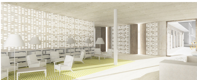
Legende: Alterszentrum St. Anna Luzern: Innenansicht Erdgeschoss Siegerprojekt SPIRO von Masswerk Architekten, Luzern