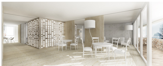
Legende: Alterszentrum St. Anna Luzern: Innenansicht Multifunktionsraum Siegerprojekt SPIRO von Masswerk Architekten, Luzern