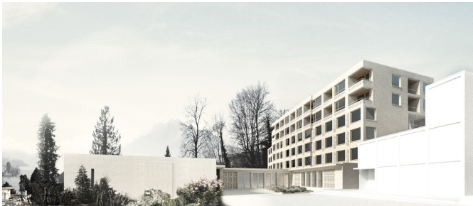
Legende: Alterszentrum St. Anna Luzern: Aussenansicht Siegerprojekt SPIRO von Masswerk Architekten, Luzern